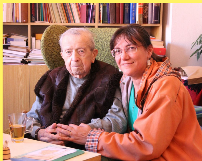
arcibiskupa Otčenáška provázela až do posledních chvil jeho života

Řešením těchto problémů je rozvoj domácí hospicové péče (tzv. mobilních hospiců), její ukotvení v legislativě a nastavení úhrad za péči. Dále je potřeba v rámci podpory pečujících osob z řad rodinných příslušníků nastavit pravidla pro možnost čerpání tzv. pečovatelské dovolené za obdobných podmínek, jako je to u rodičovské dovolené, aby se pečující mohl vrátit zpět na své pracovní místo, nemusel dávat kvůli péči výpověď a pak žít v nejistotě, zda nalezne vhodnou pracovní příležitost.