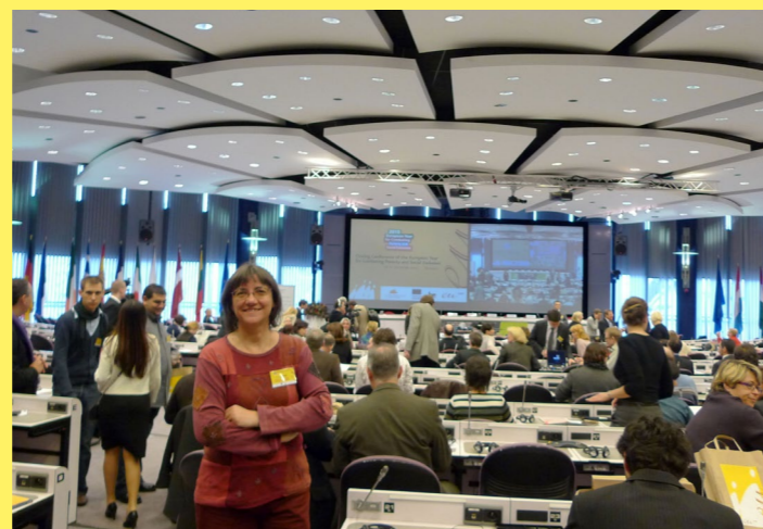
na mezinárodní konferenci v Bruselu

Již v souladu se stávající legislativou lze při zachování kritéria nejnižší ceny zahrnout do veřejné zakázky i další témata, která se obce a instituce snaží v rámci své strategie naplňovat. Jedná se například o možnost požadovat zajištění rekvalifikace určitého počtu osob v dané obci, zaměstnání lidí evidovaných na úřadu práce nebo osob se zdravotním znevýhodněním, umožnění stáží, exkurzí žákům a studentům, požadovat použití ekologicky šetrných materiálů a postupů, nákupu fair trade produktů apod.